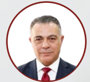
معالي الدكتور وسام الربضي عضواً