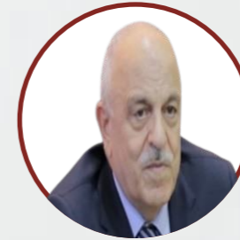
معالي الدكتور رجائي المعشر رئيس مجلس الأمناء