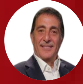
سعادة السفير مازن الحمود نائب رئيس مجلس إدارة