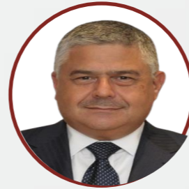
معالي السيد عمر ملحس نائب الرئيس